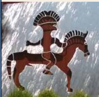
Museo Retico Sanzeno

Seguendo questo percorso sarà possibile accostare criticamente alcuni nodi fondamentali del pensiero etico - filosofico, della storia generale e di quella locale, della dimensione religiosa e spirituale.