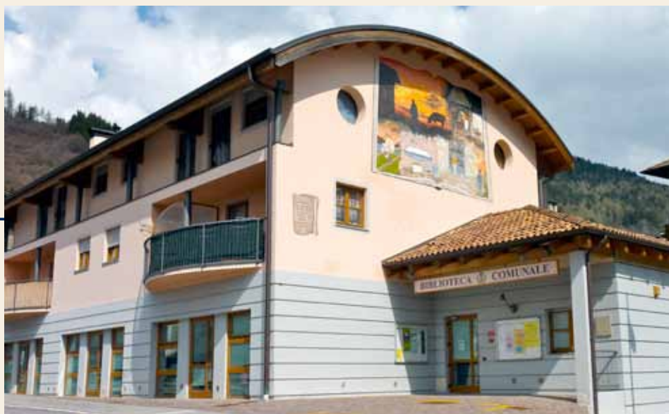
Sede UTETD di Roncone

Le SEDI LOCALI offrono un numero di corsi ed un monte ore annuale di attività culturali ridotto rispetto alla sede centrale.